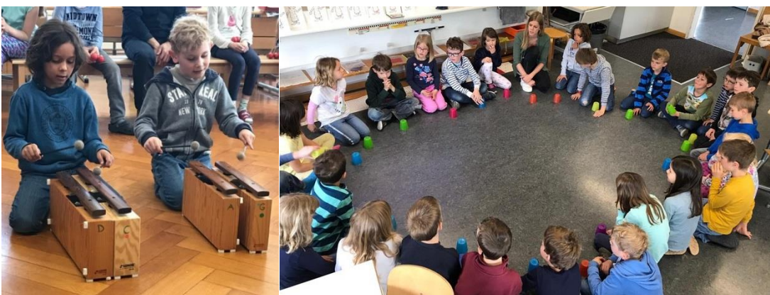
Gemeinsames Musizieren der 1.-3. Klasse