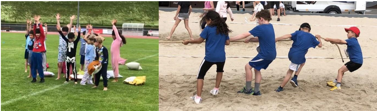
Tanzaufführung und Seilziehen am Sporttag „Spiel ohne Grenzen“