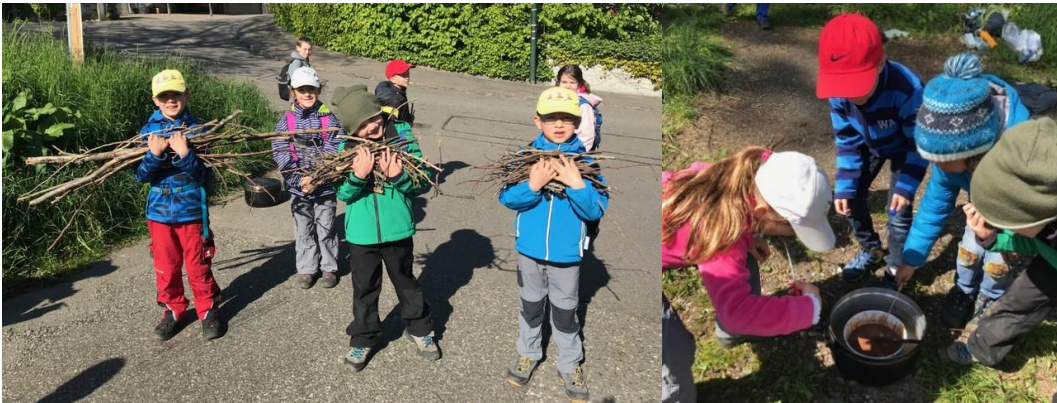
Unser Waldtag mit leckerem Schoggifondue

In der kurzen Zeit, die uns bis zu den Sommerferien noch bleibt, steht noch einiges auf dem Programm: Unsere Schulreise, der Sporttag, ein kleines ABC-Fest nach Abschluss des Buchstabenlernens, die Zeugnisse, das Kistenpacken vor dem grossen Umzug ins neue Schulzimmer und vieles mehr. Wir freuen uns noch auf diese spannenden Tage! Hier noch einige Schnappschüsse aus den vergangenen Wochen: